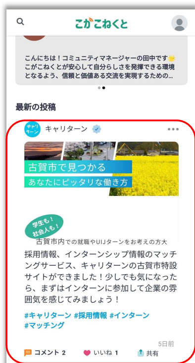
コミュニティマネージャーや企業が投稿