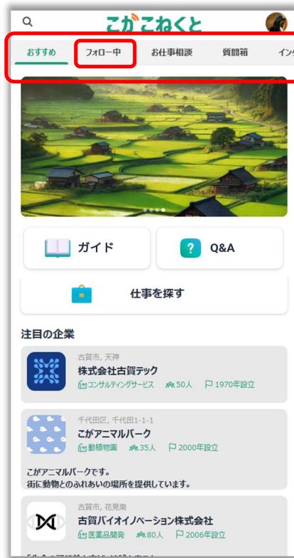
トップページからカテゴリタブ選択