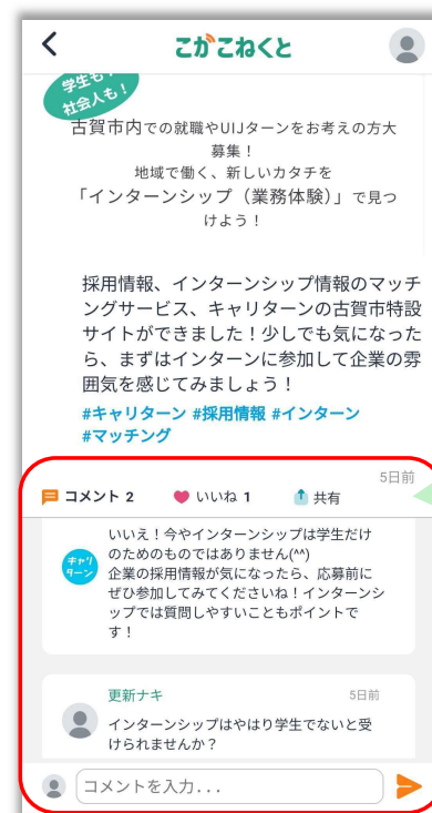
投稿に対するコメント、いいね、共有